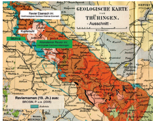
Übersichtskarte Geologie und Bergbau am Südwestrand des Thüringer Waldes (Auswahl).

wird ein Waldgebiet hinter der Ortslage Kupfersuhl, im Quellgebiet des Flüsschens Suhl. Umfangreicher ist die Quellenlage hinsichtlich des Kupferschieferbergbaus im Revier Eisenach (Stedtfeld-Eckartshausen-Kupfersuhl). Die ersten durch Quellen belegten Informationen stammen aus dem Jahr 1446. Aus dem Jahr 1522 ist ein Streit um das Bergregal zwischen dem sächsischen Fürstenhaus und einer ortsansässigen Adelsfamilie belegt. Als ein Bergbauzentrum in der 2. Hälfte des 16. Jahrhunderts wird das Dorf Eckartshausen, zwischen Eisenach und Kupfersuhl gelegen, genannt. Hier führte der Zuzug von Berg- und Hüttenleuten zu Veränderungen in der ländlich geprägten Sozialstruktur.