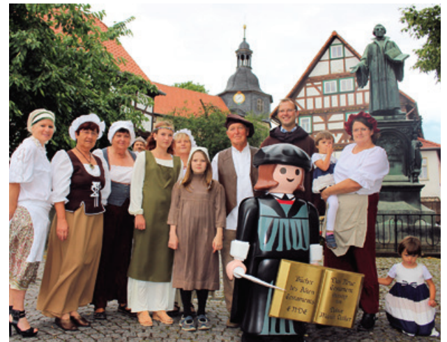
Einwohner von Möhra stellen das Luther-Gemälde nach.

Weiterhin werden der Familie Luder u. a. Aktivitäten „in der Kupferproduktion bzw. –Verarbei-