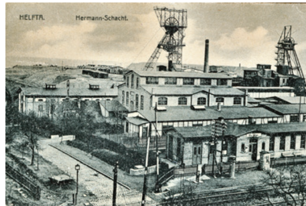
Kupferschieferbergwerk Hermann Anfang des 20. Jahrhunderts.

Im Jahr 1916 wurden insgesamt 1,180 Mio. t Erz aus den Bergbaubetrieben zu den Schmelzhütten geschickt. Diese Erzmenge wurde im untertägigen Abbau sowie aus der Kläbung von Halden gewonnen. Damit wurde eine Steigerung der Erzmenge von ca. 147 % gegenüber