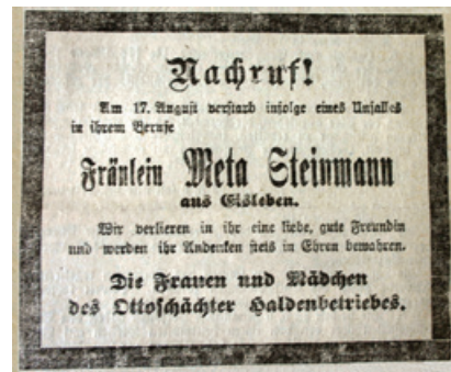
Eisleber Zeitung vom 18.08.1916.

Im Jahr 1915 waren im Kupferschieferbergbau 1.483 Frauen beschäftigt. Ihre Zahl stieg auf 2.776 Frauen bis Ende 1916. Die Schwere und die Gefährlichkeit ihrer Arbeit auf den Halden, ungeschützt allen Witterungsunbilden ausgesetzt, lässt sich heute nur noch errahnen. Am 14. August 1916 verunglückten im Haldenbetrieb des Ottoschachtes bei Wimmelburg zwei Kläuberinnen. Beide Frauen verstarben bereits kurze Zeit nach ihrer Einlieferung in das Krankenhaus. Die im Bergbau sprichwörtliche Kameradschaft, hier die der unter bergbaulichen Verhältnissen arbeitenden Frauen und Mädchen des Ottoschächter Haldenbetriebes, kommt in einem Nachruf für ihre verunfallte Kameradin bewegend zum Ausdruck.