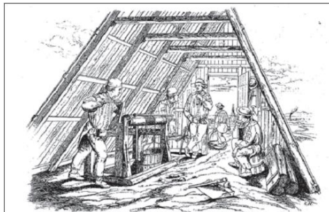
Ein Haspelzug im sächsischen Erzbergbau (Eduard Heuchler, Dresden 1857).

schmunzelnden Ausdruck der Befriedigung entgegengenommen.