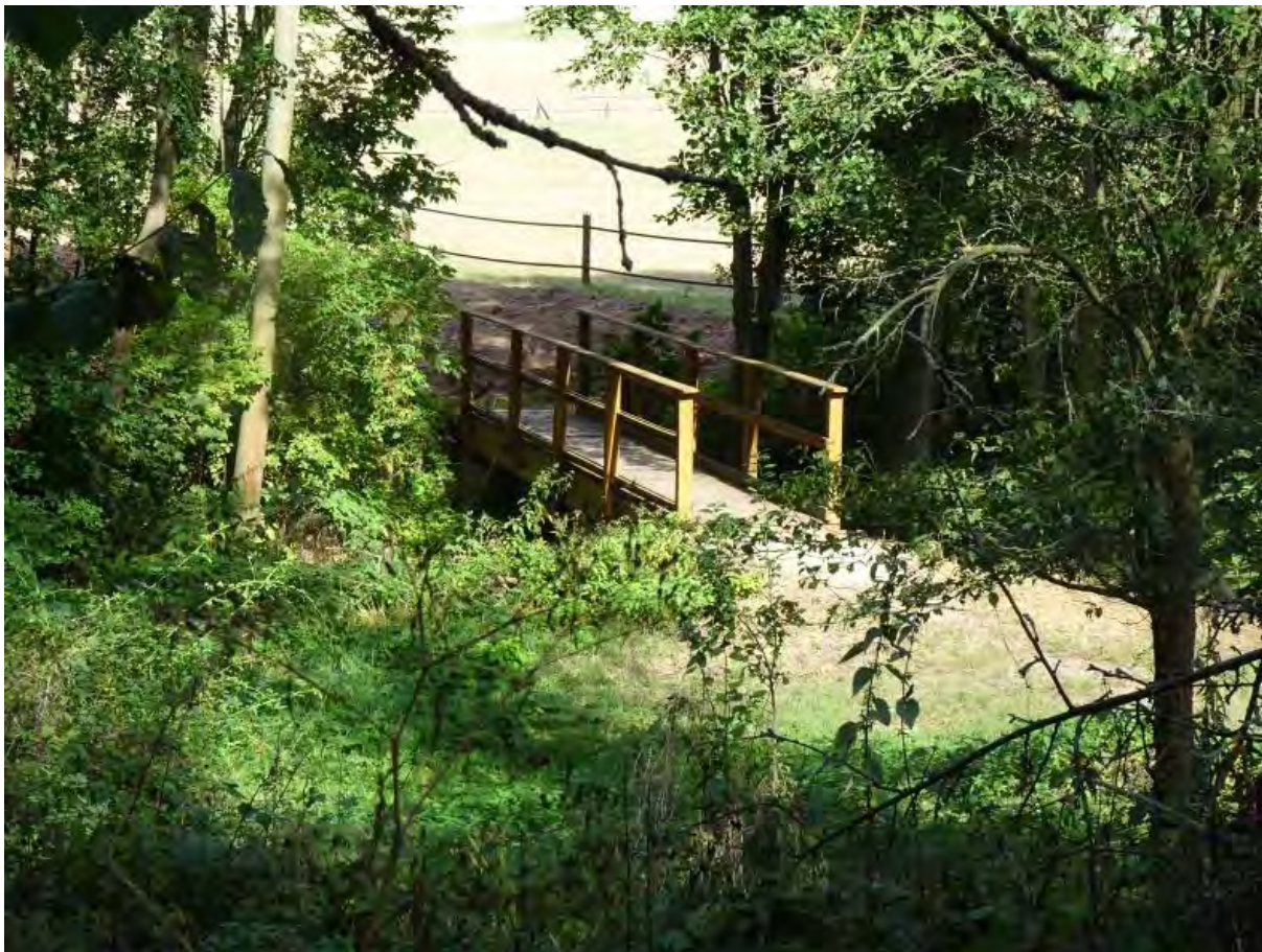
Fußgängerbrücke über die Gonna

Etwa 750 m bachaufwärts direkt an der Gonna liegt das nur schlecht zugängliche Mundloch des Gonnaer Stollen.