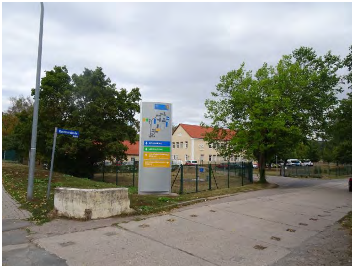
CJD Standort Sangerhausen

Auf dem Gelände des Christlichen Jugenddorfs befand sich bis 1990 die Betriebsberufsschule für den Kupferschieferbergbau. Hier wurden zwischen 1958 und 1990 insgesamt fast 5000 Häuer, Förderleute, Schlosser und Elektriker für den Bergbau ausgebildet. Das Christliche Jugenddorf existiert seit 1991.