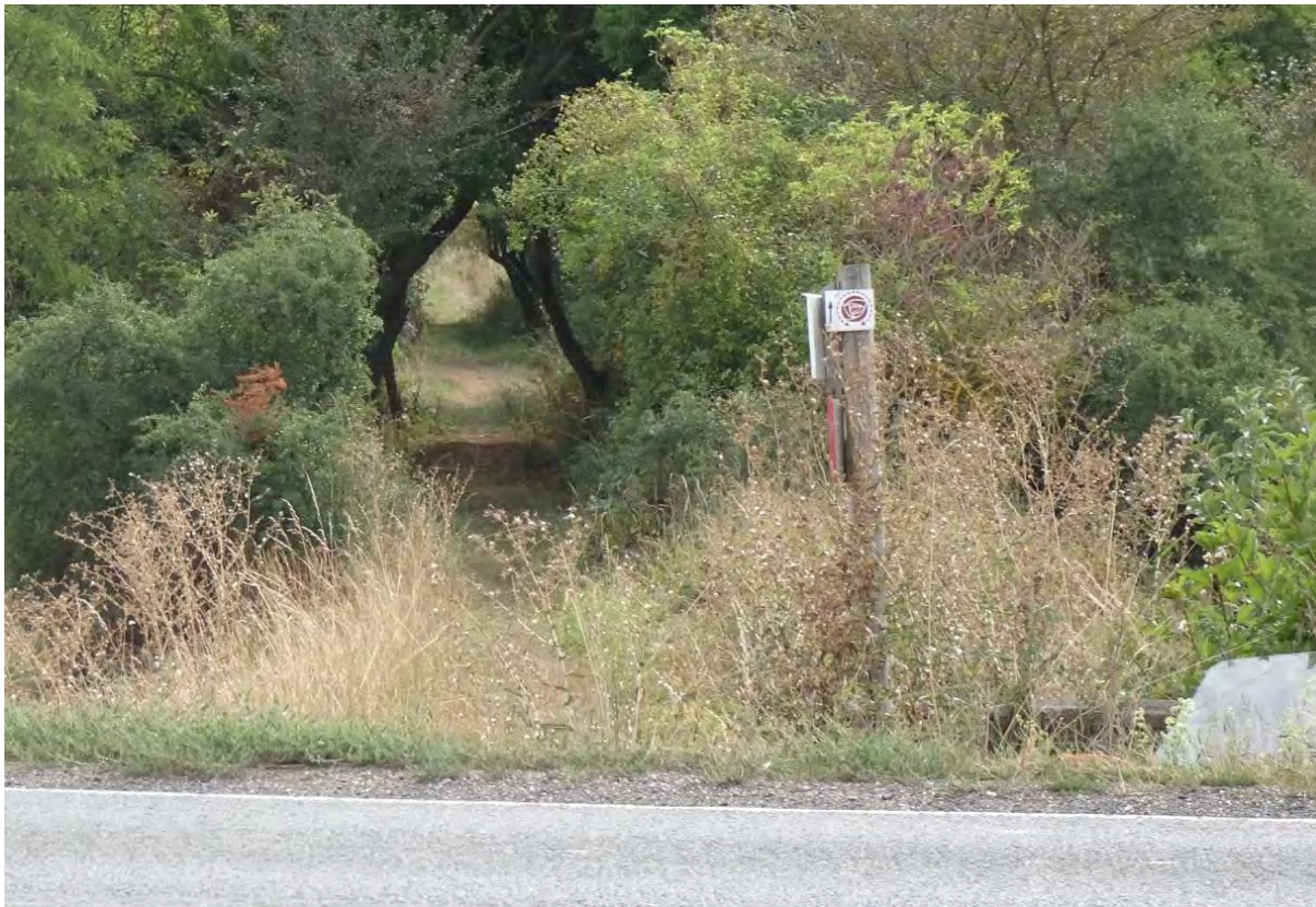
Blick von der Landstraße Richtung Gonnabrücke

Auf der anderen Seite der Landstraße bestehen am Beginn der Fortsetzung des Wildrosenpfades eingeschränkte Parkmöglichkeiten.