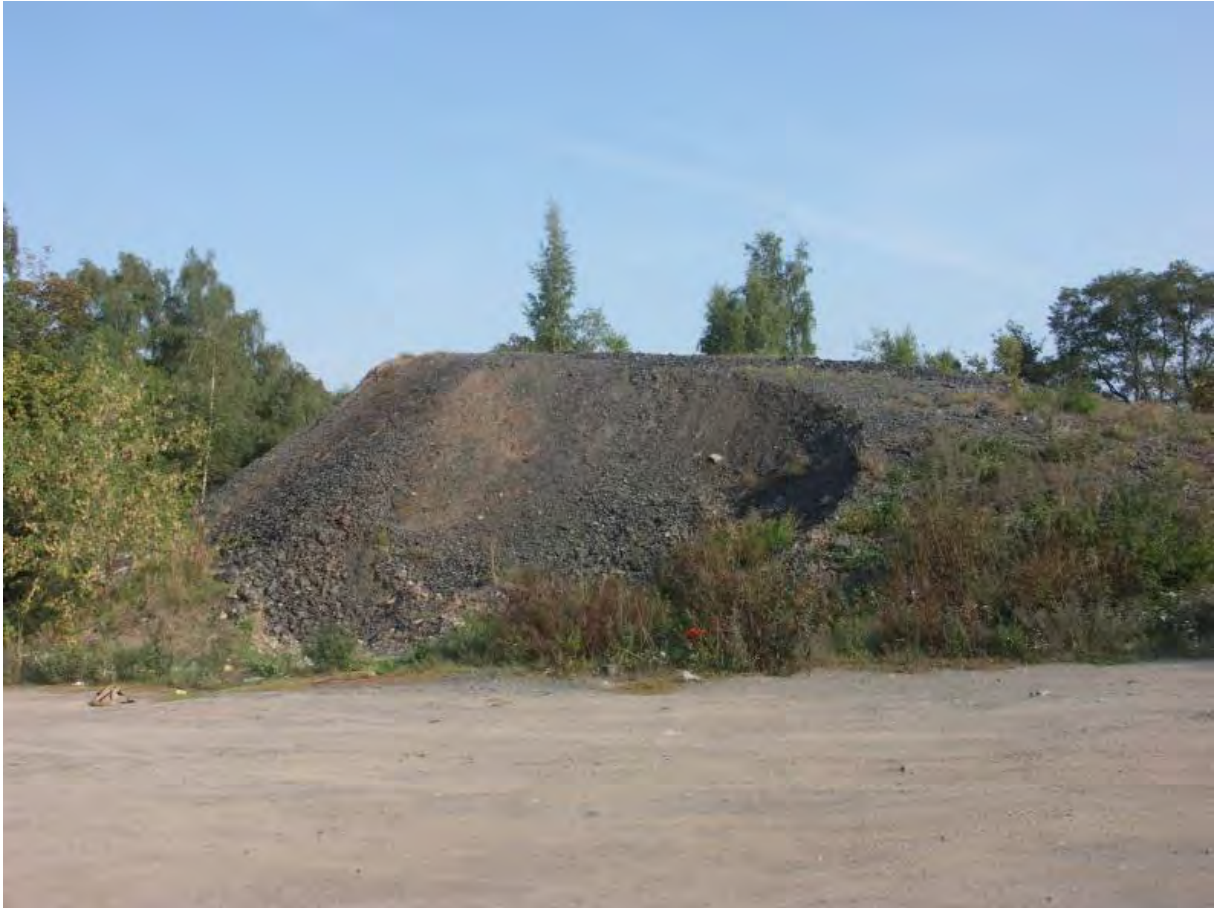
Halde der Kupferhütte Sangerhausen

Ausgangspunkt der Tour ist der Parkplatz an der Kupferhütte Sangerhausen