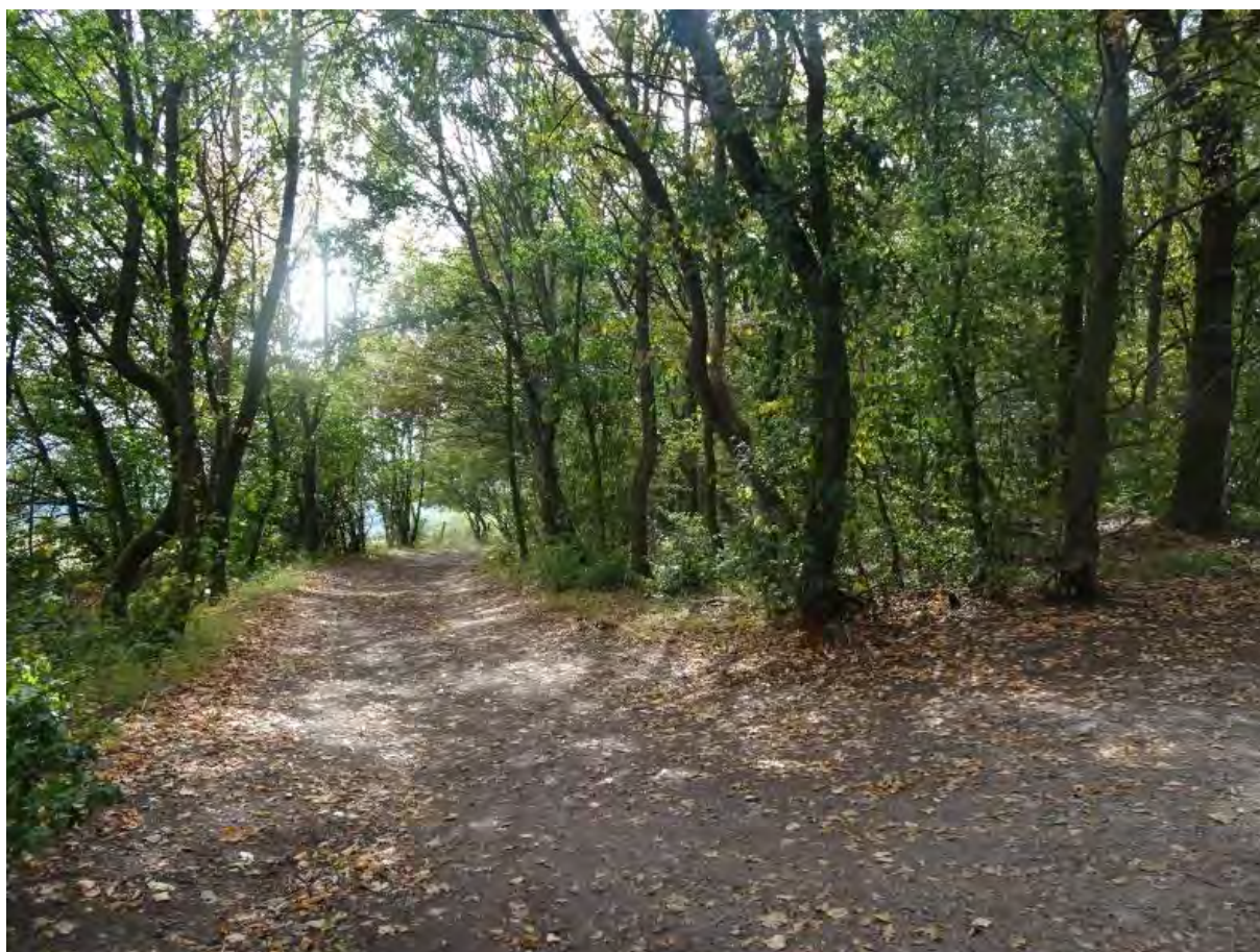
Wildrosenpfad östlich der Halde

Die Länge der Abkürzungsstrecke beträgt ca. 1,2 km.