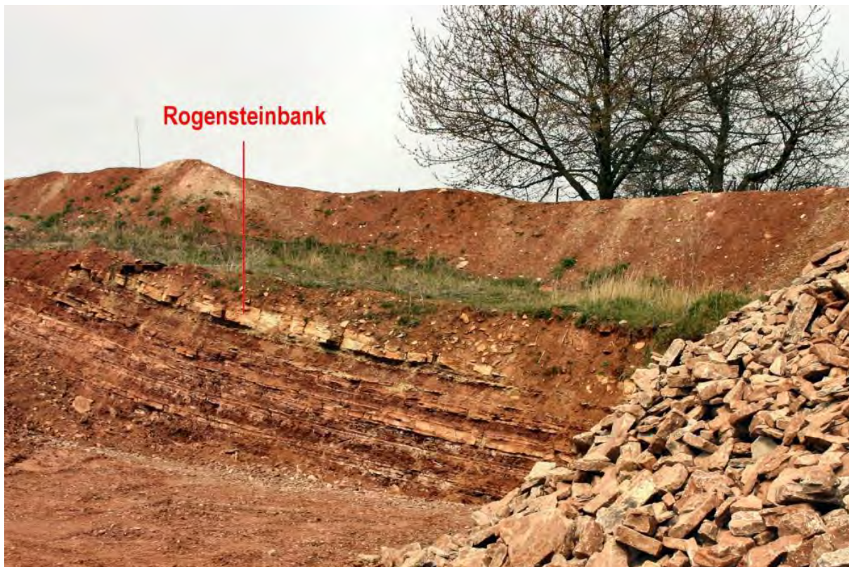
Rogensteinbank im Steinbruch Lengefeld

Rogenstein wurde und wird als plattiges Gestein gewonnen, um es z.B. als Wegeplatten beim Straßenbau zu verlegen. Rogenstein ist ein Schichtglied des Unteren Buntsandsteins. Das Gestein besteht aus kleinen, bis erbsengroßen Kalkkugeln (Ooiden), die durch kalkigen Zement verbunden sind.