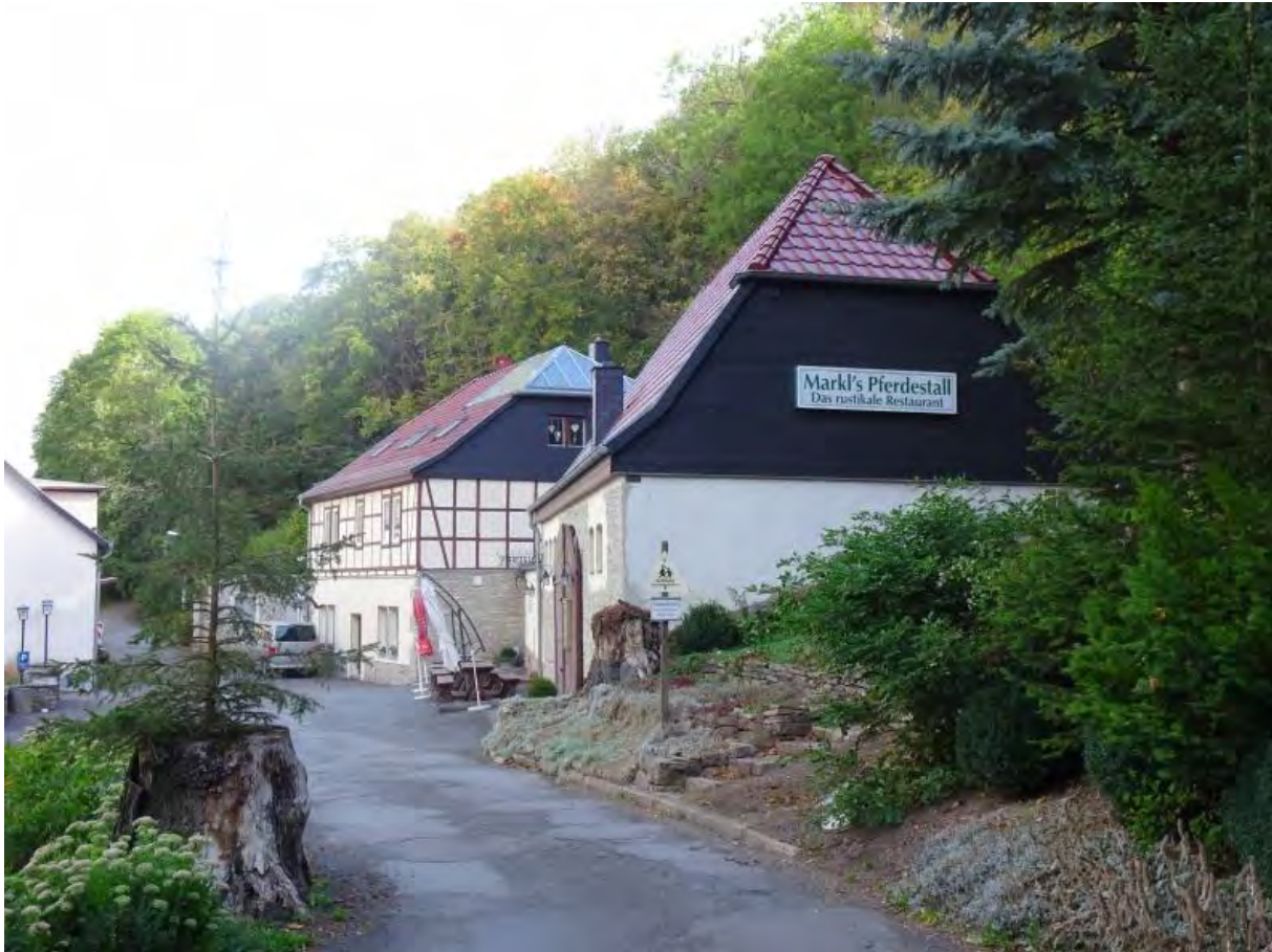
Die Walkmühle im Jahr 2019

Die Walkmühle ist seit 1490 als Mühle der Tuchmacher und Wollweber (walken und verfilzen der Textilien) bekannt. Sie war zeitweise auch eine Kornmühle. Gaststätte ist sie seit dem Ende des 18. Jh.