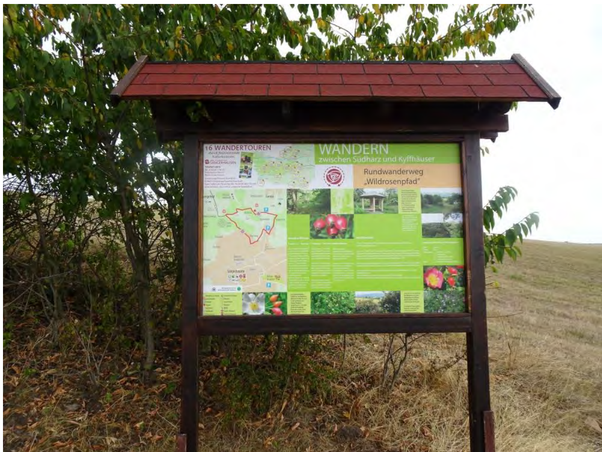
Schautafel zum Wildrosenpfad

Der Standort auf der Höhe ermöglicht einen eindrucksvollen Rundblick auf das Sangerhäuser Umland.