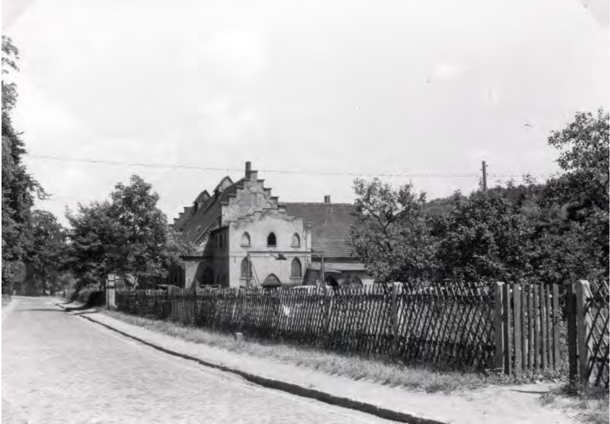
Gebäude der Kupferhütte von Südwesten (1966)

Die Tour folgt über weite Strecken dem gut ausgeschilderten Rundwanderweg "Wildrosenpfad" . Ihr ist Ausgangspunkt ist der Parkplatz an der Kupferhütte Sangerhausen