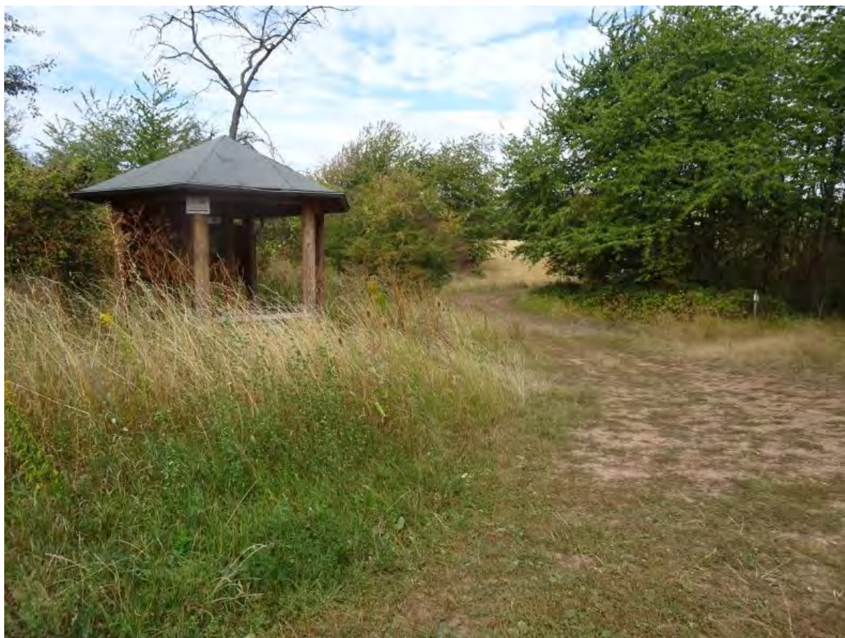
Schutzhütte am Haldenfuß

Am nördlichen Haldenfuß stoßen wir bei unserer Wanderung auf eine Schutzhütte mit informativen Schautafeln zum Biosphärenreservat Karstlandschaft Südharz