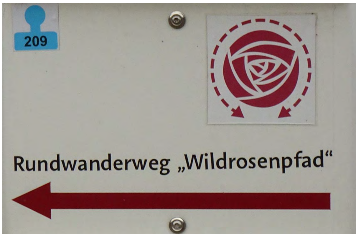
Kennzeichnung des Wildrosenpfades