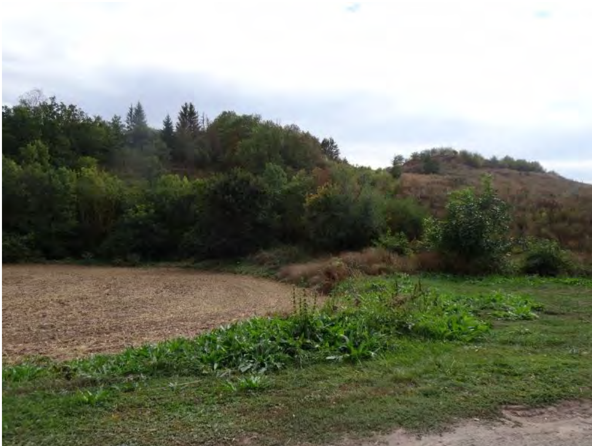
Halde im Brühltal

Mit dem Teufen des Thomas-Münzer-Schachtes (damals Schacht Sangerhausen) 1944 fiel Gestein (Berge) an. Schon vorher mussten die Gesteinsmassen, die bei der Schaffung des Schachtplanums anfielen, beseitigt werden. Sie wurden am Nordhang des Schachtplateaus ins Brühltal verstürzt.