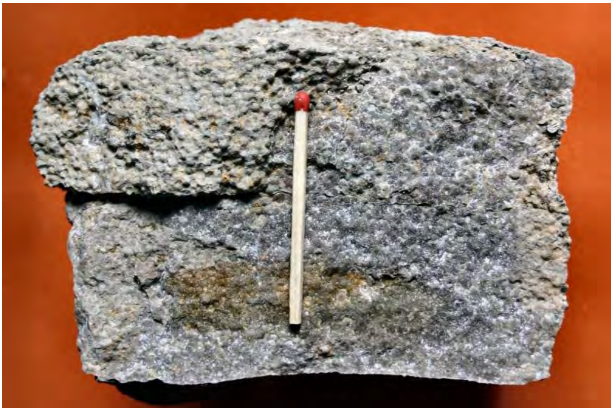
Rogensteinplatte aus dem Steinbruch Lengefeld (Foto Dr. S. König - 2007)

Die Rogensteinbänke bewirkten wegen ihres Widerstandes gegen die Verwitterung, dass zwischen Lengefeld im Norden und Sangerhausen im Süden der Höhenzug entstand, der heute die Halde „Hohe Linde“ trägt. Nördlich davon liegt der Ort Lengefeld auf den weichen, tonigen Gesteinen des Unteren Buntsandsteins, die der Verwitterung zum Opfer fielen und so zu einer Talbildung führten.