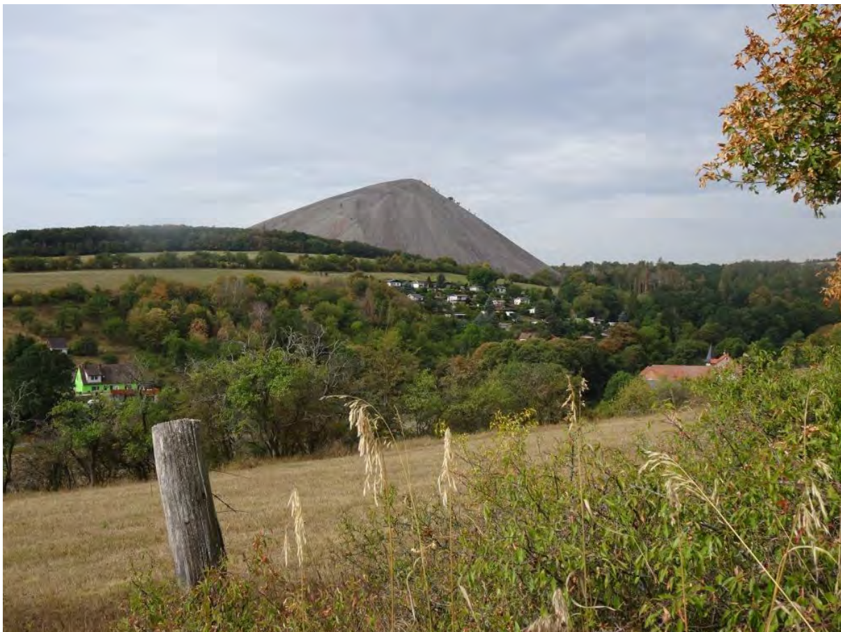
Blick über das Helmstal auf die Hohe Linde

Beim Blick nach Süden sehen wir die den Stadtkern von Sangerhausen. Ins Auge fallen auch die Spitzkegelhalden weiterer Großschachtanlagen des Reviers: